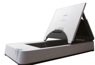
A4 Flatbed Scanner Unit 101