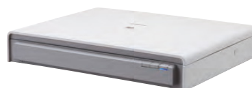
A3 Flatbed Scanner Unit 201

Breid uw scanner uit met de optionele Flatbed Scanner Unit 101 voor documenten tot A4, of Flatbed Scanner Unit 201 voor A3, zodat u ook ingebonden en kwetsbare documenten moeiteloos kunt scannen. De flatbedscanners worden aangesloten via USB en werken naadloos samen met de DR-M140, zodat u in één handeling vanuit twee scanbronnen kunt scannen en op iedere scan dezelfde functies voor beeldverbetering kunt toepassen.